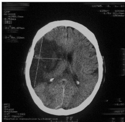
Obr. 2. Nález rozsáhlého hypodenzního ložiska v oblasti ACM I. dx. (provedeno s odstupem 24 hodin, pacient IV).