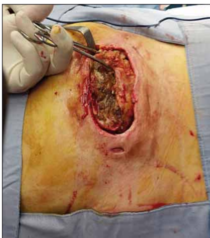
Obr. 1. Trochanterický dekubitus s pseudocystou.

Fig. 1. Trochanteric decubitus (pressure ulcer) with pseudocyst.