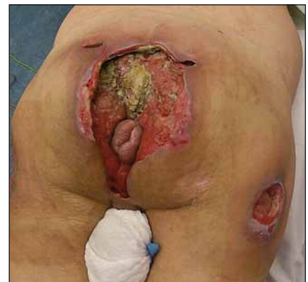
Obr. 7. Rozsáhlý sakrogluteální dekubitus.

1. European Pressure Ulcer Advisory Panel and National Pressure Ulcer Advisory Panel. Treatment of pressure ulcers: Quick Reference Guide. Washington DC: National Pressure Ulcer Advisory Panel 2009.